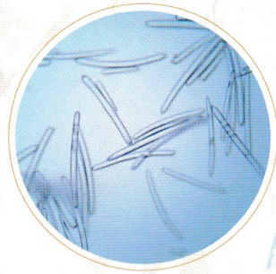
マイクロニードル (約220~280 \mu m)

気になるエイジングサインにアプローチし、うるおいを与え若々しい印象のお肌へ導きます。